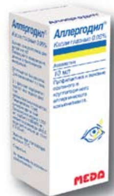
РУ П N012735/01