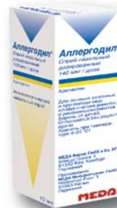
РУ П N012735/02